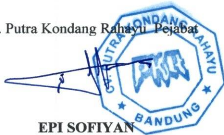
EPI SOFIYAN Direktur